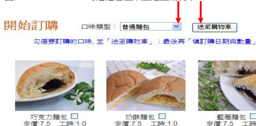
圖五 3-1.填寫訂購日期與數量（會出現如圖六所示）